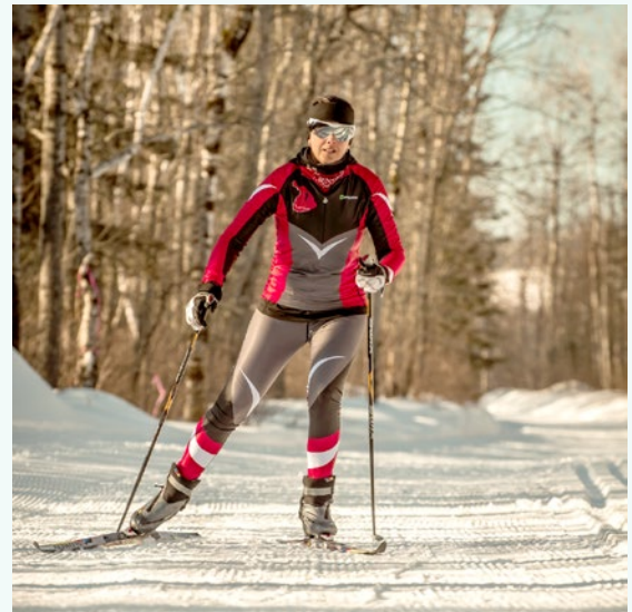
© Ski de patin, Ville de La Tuque