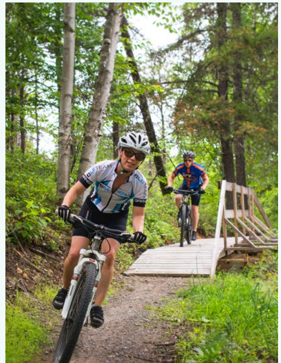
© Vélo de montagne à la forêt récréative de Val d'Or, Marie-Claude Bédard

On peut penser à des sentiers, à des parcs, à des plans d'eau, à des parcs nautiques, à des corridors verts, blancs ou bleus, à des terrains et des espaces naturels (aménagés ou non). Ces lieux de pratique sont facilement accessibles, entre autres par un moyen de transport actif, et le temps de déplacement pour y arriver est court et raisonnable. Il faut de 10 à 15 minutes pour s'y rendre à pied ou à bicyclette. Le plein air de proximité s'intègre facilement à la routine et contribue à un mode de vie physiquement actif.