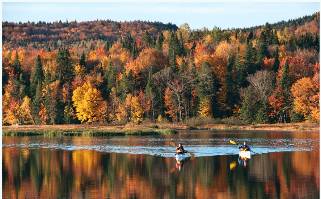
© Kayak au Marais du Nord, Office du tourisme de Québec, Francis Fontaine

Comment entrevoir désormais le rôle des municipalités dans le contexte en constante évolution du plein air de proximité? Voici comment Le plein air de proximité : un outil pour le développement local et municipal! , présente les enjeux et les pistes d'action au niveau municipal.